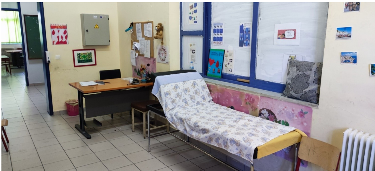
Υπεύθυνη αναρρωτηρίου και αίθουσας covid η σχολική νοσηλεύτρια κα Αργυροπούλου